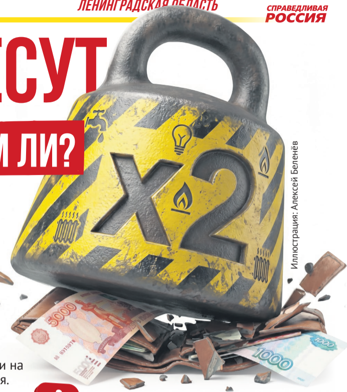
Иллюстрация: Алексей Беленёв

Для тех, у кого расходы на ЖКУ превышают определенный процент от дохода, предусмотрены субсидии. По стране этот порог составляет 22 % (в Москве – 10 %, в Санкт-Петербурге – 14 %). В Ленинградской области действует общероссийский норматив. Если семья тратит на коммуналку больше пятой части своего дохода, она имеет право обратиться за компенсацией. Субсидия носит заявительный характер – автоматически ее не назначают. Однако всегда можно обратиться к представителям СПРАВЕДЛИВОЙ РОССИИ – здесь подскажут, как снизить расходы на ЖКУ конкретно в вашем случае.