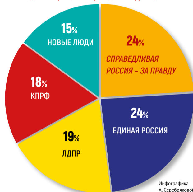
Инфографика А. Серебряковой