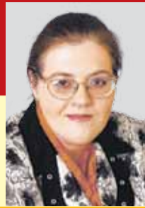
Вероника КАТОРГИНА, депутат Законодательного собрания Ленобласти

- Член постоянной комиссии по жилищно-коммунальному хозяйству и топливно-энергетическому комплексу; - Член постоянной комиссии по строительству, транспорту, связи и дорожному хозяйству.