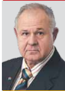
Дмитрий СИЛАЕВ, депутат Законодательного собрания Ленобласти

- Член постоянной комиссии по жилищно-коммунальному хозяйству и топливно-энергетическому комплексу; - Член постоянной комиссии по строительству, транспорту, связи и дорожному хозяйству