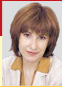
Валерия КОВАЛЕНКО, депутат Законодательного собрания Ленобласти

- Заместитель председателя постоянной комиссии по экологии и природопользованию; - Член постоянной комиссии по жилищно-коммунальному хозяйству и топливно-энергетическому комплексу